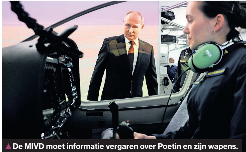
▲ De MIVD moet informatie vergaren over Poetin en zijn wapens.

Over welke militaire capaciteiten beschikt Rusland nog, welke nieuwe wapens ontwikkelt het land, welke landen leveren welke wapens? Relatief gezien nog gemakkelijke kwesties in vergelijking met de vraag wat Poetin ermee van plan is. Voor het beant-